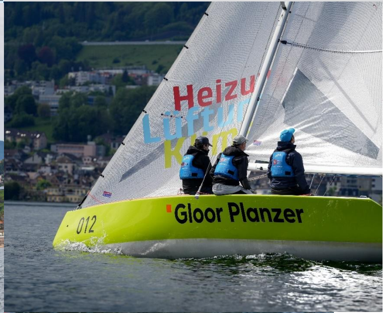
WOMEN'S SAILING CHAMPIONS LEAGUE 2021