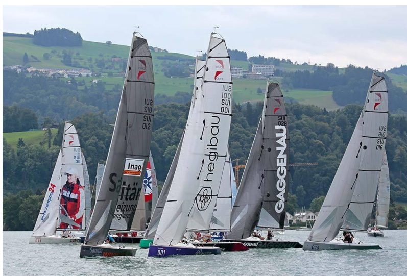
Onyx Regatta, Bächau, Zürichsee